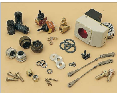
Selección de components de un proyecto de modificación/actualización emprendido por Repaircraft