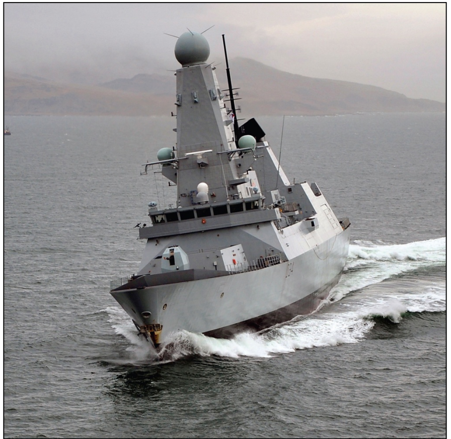
El buque HMS Diamond, de la Marina Real del Reino Unido

Tableros de circuitos para un sistema informatizado de registro secuencial de datos