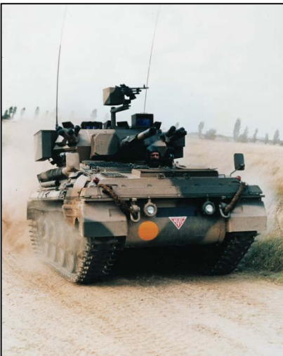
Tanque ligero Scorpion