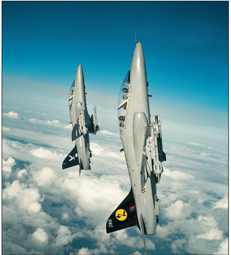
Avión Hawk, de la Real Fuerza Aérea del Reino Unido