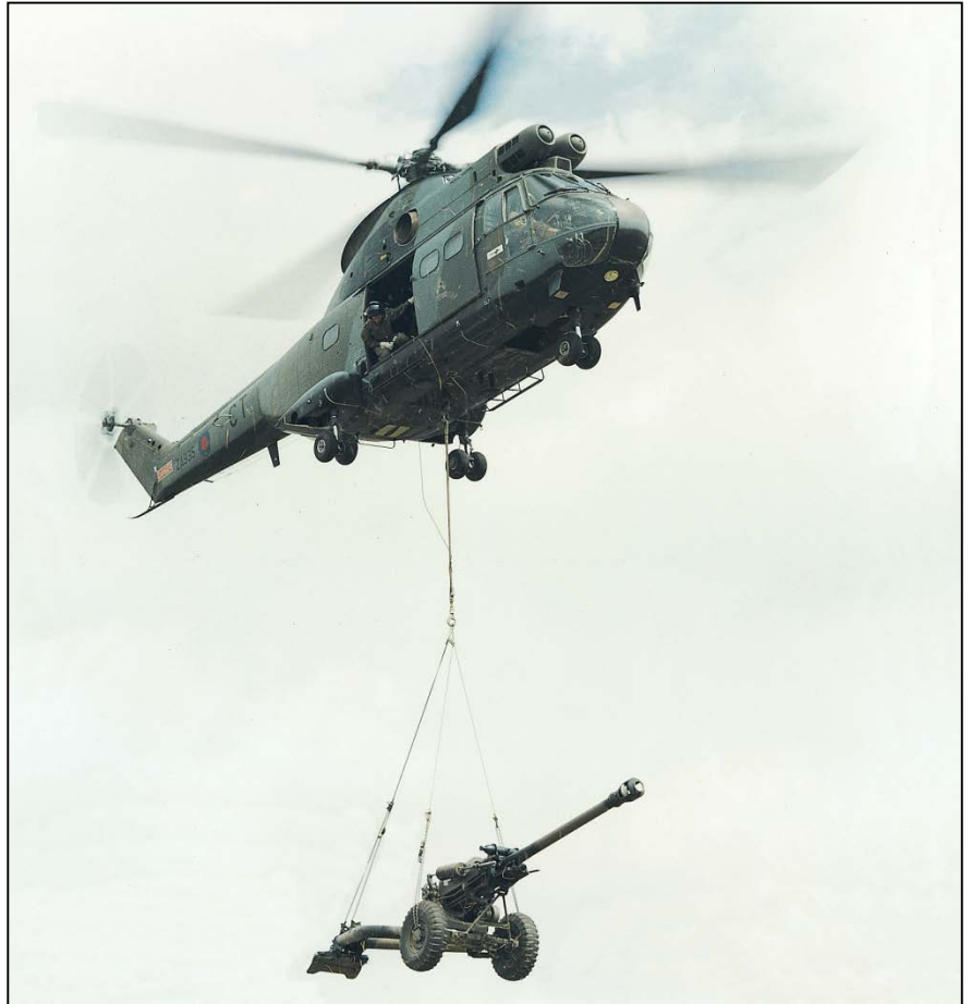
Cañón de 105 mm transportado por un helicóptero Puma