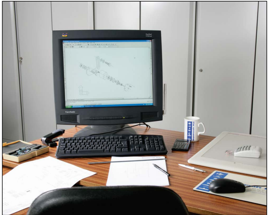
Las bases de datos de Repaircraft cuentan con información acerca de más de 20 millones de artículos

La División Técnica de Repaircraft ofrece asimismo una gran variedad de servicios de inspección y reparación.