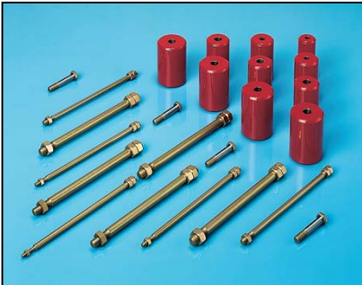
Conjunto deservicio fabricado para el obús de 155 mm

Repaircraft suministra repuestos y sistemas para todo tipo de vehículos de combate, lanzamisiles, artillería, equipo de construcción de puentes, vehículos de transporte, camiones, remolques, vehículos utilitarios ligeros, equipo de reaprovisionamiento, generadores, equipo de comunicaciones, equipo de vigilancia, etc.