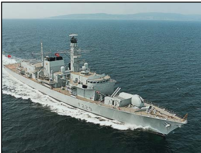
Frigata Tipo 23

Transformadores rellenos de aceite resistentes a los choques y diversos componentes eléctricos para un proyecto de mantenimiento de radar naval