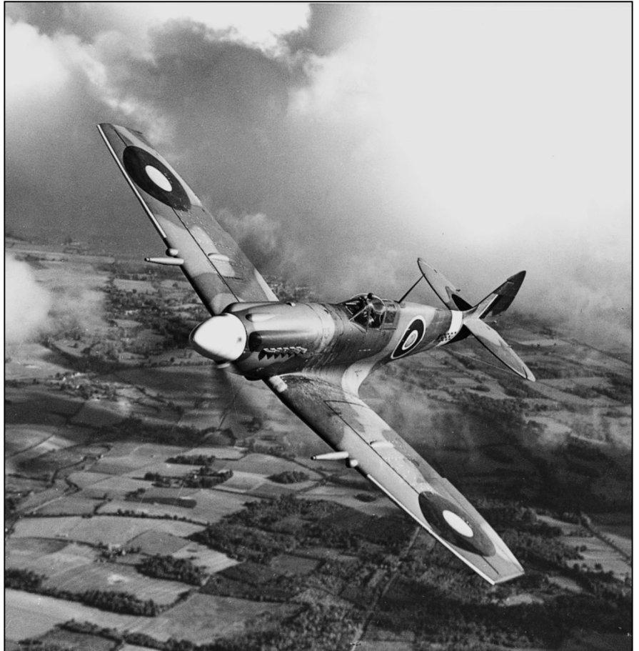
Spitfire MK XII, con el apoyo técnico de Repaircraft en los años 40

En resumen, al combinar nuestro personal – compuesto por investigadores, ingenieros, compradores e inspectores de control de calidad muy capacitados y experimentados – con un sistema ultramoderno y totalmente integrado de gestión y operaciones informatizadas, Repaircraft puede ofrecer un apoyo total.