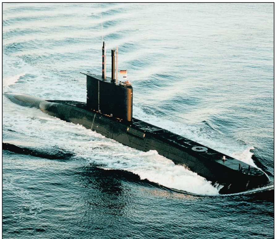
Submarino Tipo 209