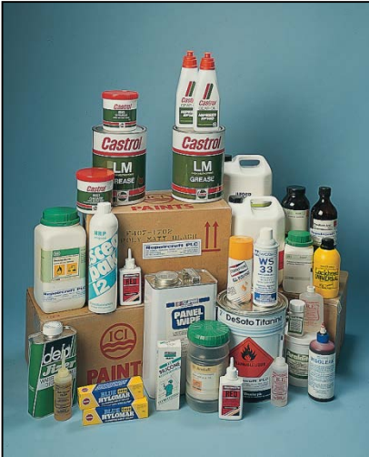
Pinturas, selladores, adhesivos y lubricantes, etc. suministrados por Repaircraft

Repaircraft suministra repuestos y sistemas para todo tipo de aviones, helicópteros, misiles, armamento, equipo electrónico de aviación, equipo de vigilancia, equipo de apoyo terrestre, simuladores para formacion de personal, etc.