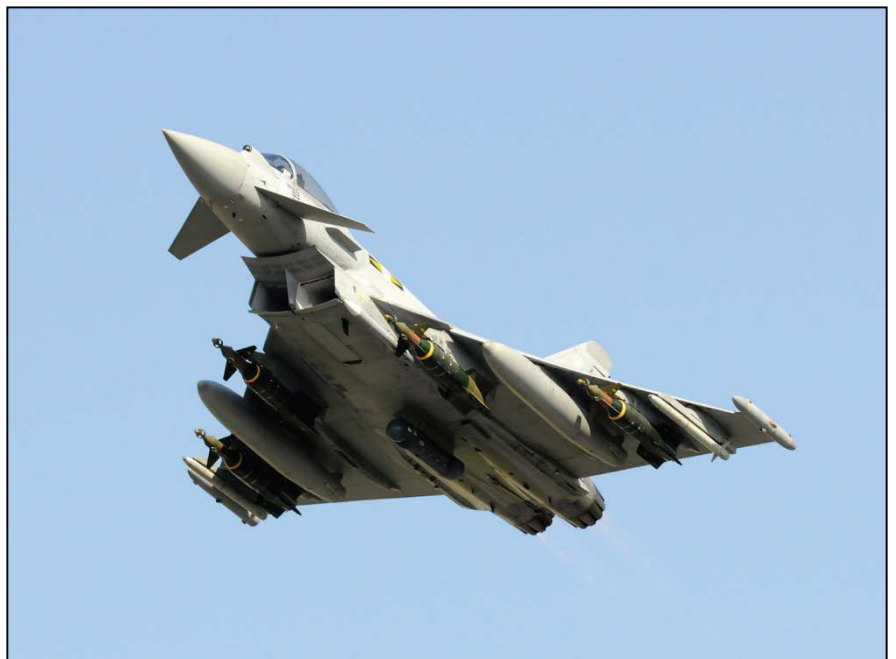
Avión Typhoon, de la Real Fuerza Aérea del Reino Unido