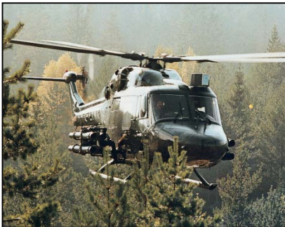
Helicóptero Lynx armado con misiles TOW