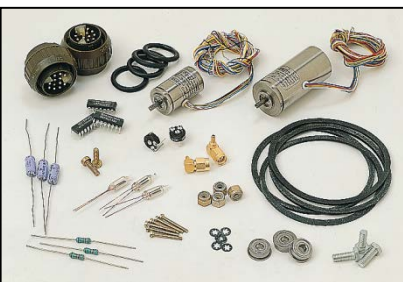
Parte de un paquete de repuestos para el sistema de misiles